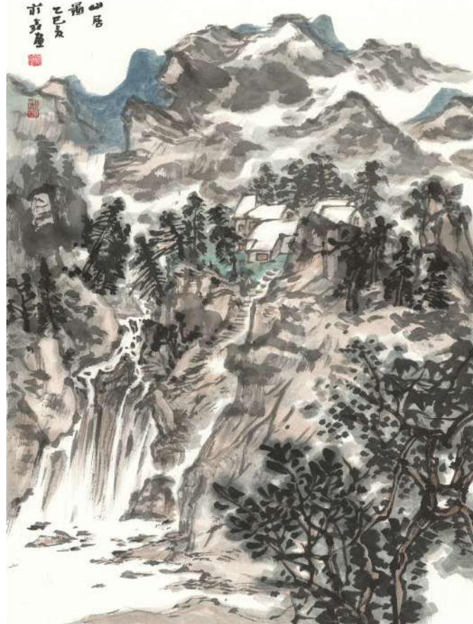
作品名称:山居图,68cm×46cm,作者:蒋鑫 教授