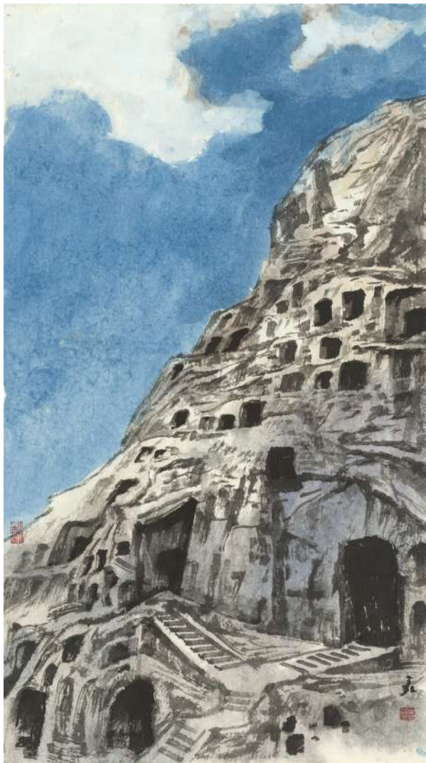
作品名称:龙门系列三,68cm×34cm,作者:蒋鑫 教授