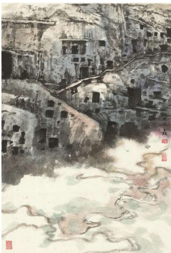
作品名称:龙门系列一,68cm×34cm,作者:蒋鑫 教授