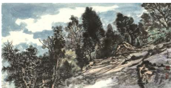
作品名称:春风,34cm×68cm,作者:蒋鑫 教授