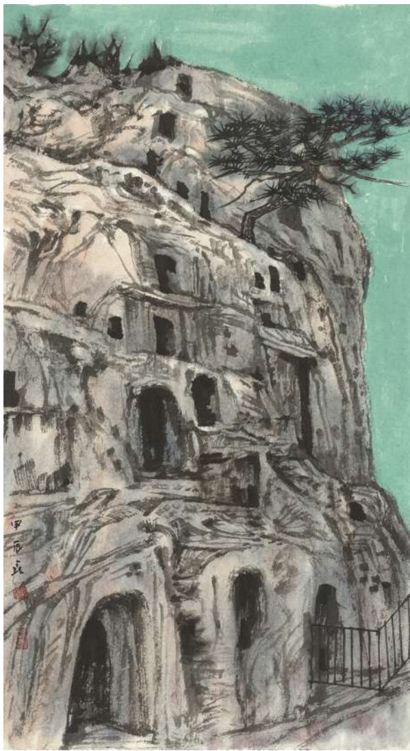
作品名称:龙门系列二,68cm×34cm,作者:蒋鑫 教授