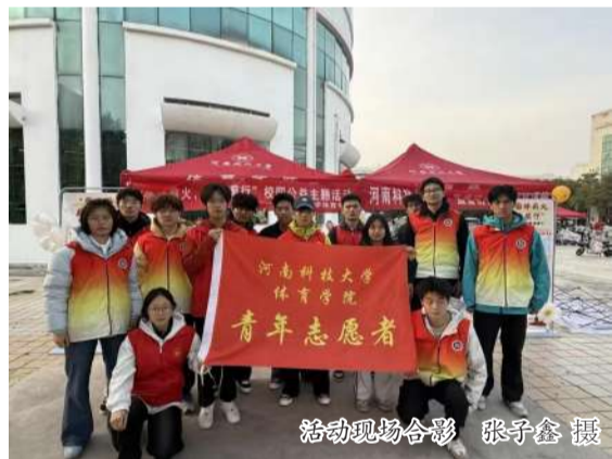
活动现场合影

捐赠结束后,我和志愿者伙伴们一起细致整理物资与书信。我们将书籍按类别摆放,把衣物折叠整齐,逐封阅读并标注书信内容,确保每一份爱心都能精准送达定点帮扶学校的孩子手中。指尖拂过带着温度的物品与文字,我仿佛看到孩子们收到礼物时雀跃的模样,也更懂得“奉献、友爱、互助、进步”的志愿精神内涵。