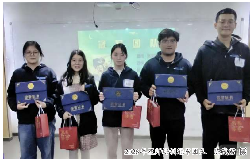
2026年星火培训冠军团队

最后,我想把这段培训的核心感悟送给自己,也送给每一位同行的伙伴:不必纠结当下与他人的差距,不必羡慕旁人的优秀,我们真正的对手从来不是别人,只有自己。往后的日子里,只和自己比,专注提升,稳步前行,始终相信,明天的自己,一定会比今天更专业、更优秀。